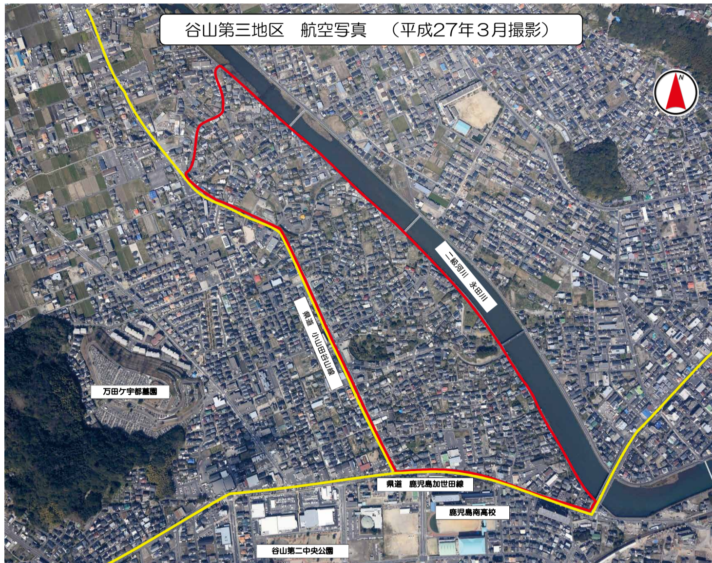
谷山第三地区 航空写真 (平成27年3月撮影)

～ 谷山第三地区土地区画整理事業に関するお問い合わせ先～ 鹿児島市 建設局 都市計画部 谷山都市整備課 谷山第二地区係 (住所) 〒891-0141 鹿児島市谷山中央五丁目26-7 (旧南部保健センター) 電話: 099-269-8436 (係直通) FAX: 099-268-2602 メール: tanito-dai2@city.kagoshima.lg.jp