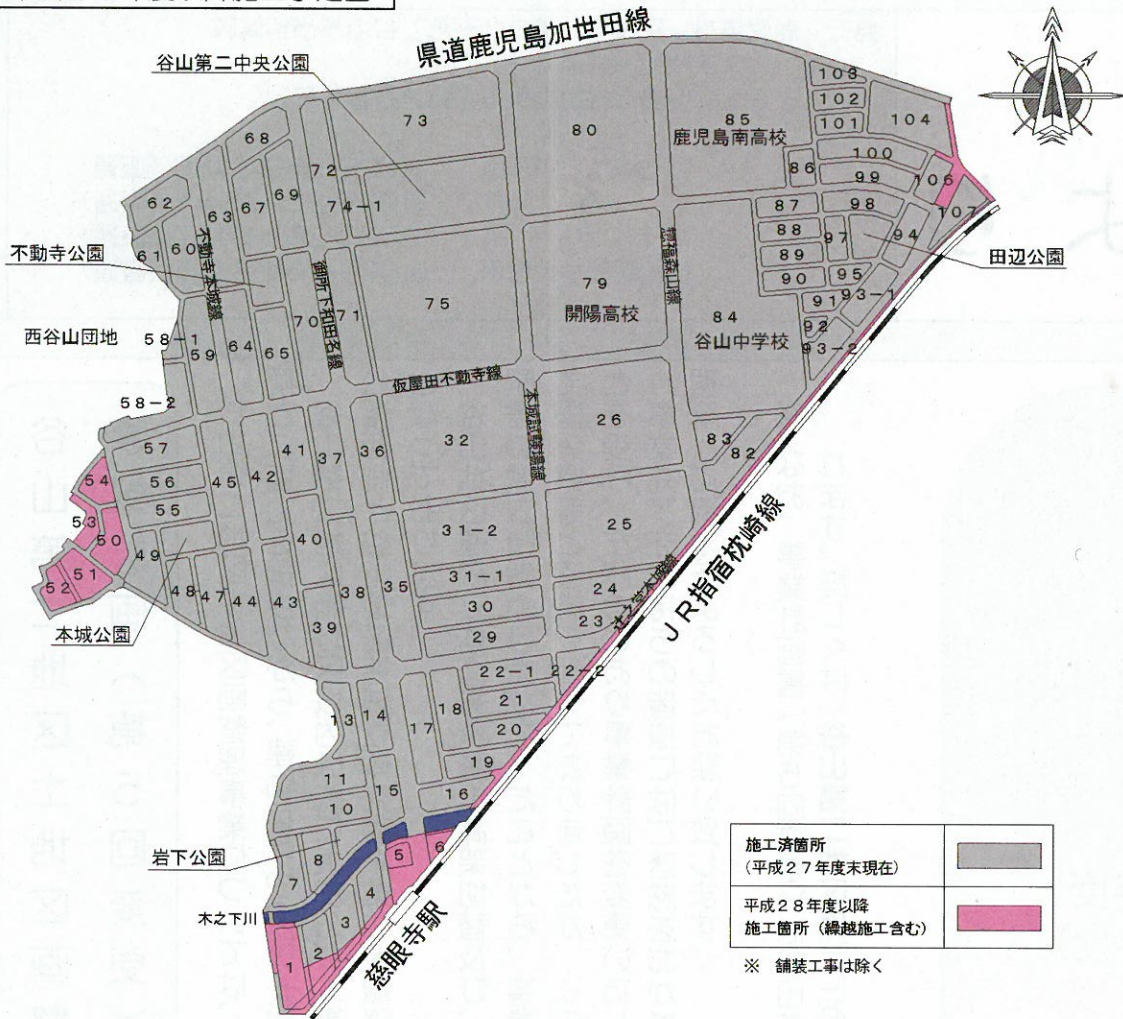
平成28年度以降施工予定図

※国からの交付金交付額の変動等により、事業内容を変更することがあります。 ※ピンク色部分は工事予定箇所であり、使用収益開始時期については、別途、お問い合わせください。