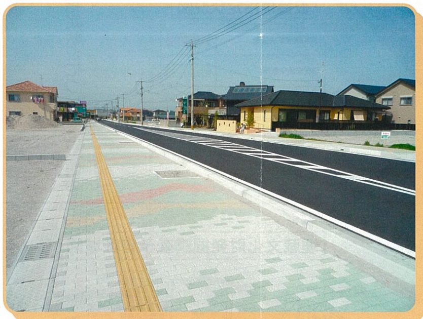
御所下和田名線 《写真②》

発行 鹿児島市 建設局 都市計画部 谷山都市計画事務所 〒891-0194 鹿児島市谷山中央四丁目4927番地 谷山支所 3階 TEL099-269-2111 (谷山支所) 谷山第二地区係 TEL099-269-8436 (直通) 工事補償係 TEL099-269-8437 (直通) 谷山駅周辺地区係 TEL099-269-8435 (直通)