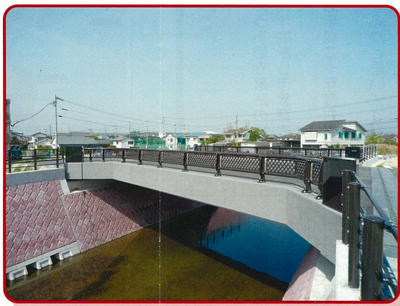
慈眼寺駅橋 (新設橋) 《写真①》