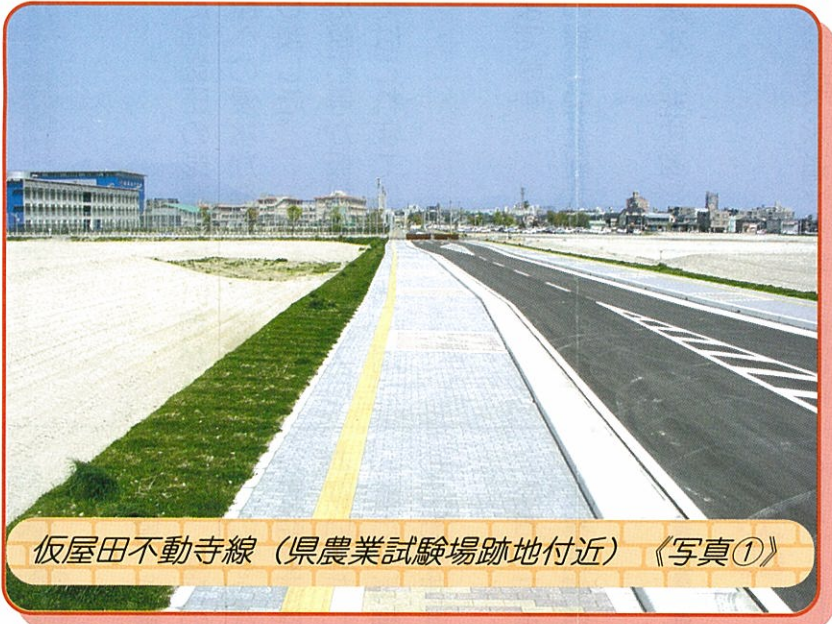
仮屋田不動寺線 (県農業試験場跡地付近) 《写真①》

発行 鹿児島市 建設局 都市計画部 谷山都市計画事務所 〒891-0194 鹿児島市谷山中央四丁目4927番地 谷山支所 3階 TEL099-269-2111 (谷山支所) 谷山第二地区係 TEL099-269-8436 (直通) 工事補償係 TEL099-269-8437 (直通) 谷山駅周辺整備係 TEL099-269-8435 (直通)