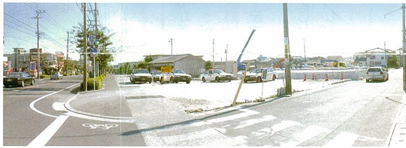
県立南高校の正門から谷山駅方向を見た風景 (写真左が県道鹿児島加世田線)

工事に関しご不明な点がございましたら、谷山区画整理事務所『工事補償係』にお問い合わせ下さい。