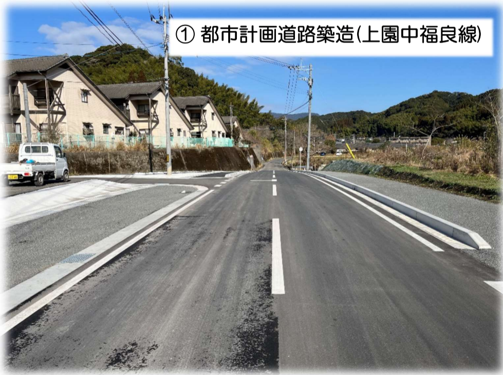
① 都市計画道路築造(上園中福良線)