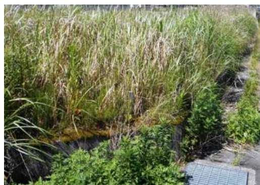
草刈り前（イメージ）

現在、使用していない仮換地をお持ちの方は、草刈り等の適切な維持管理をお願いいたします。