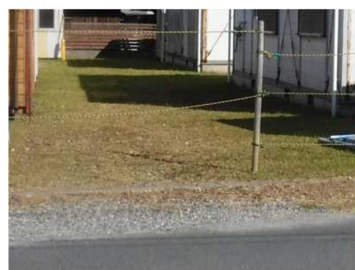
草刈り後（イメージ）