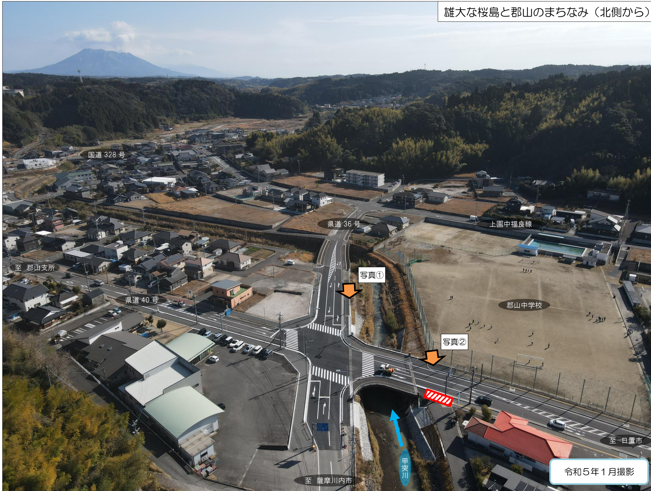
雄大な桜島と郡山のまちなみ（北側から）