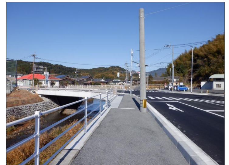
広くて歩きやすい歩道になりました。