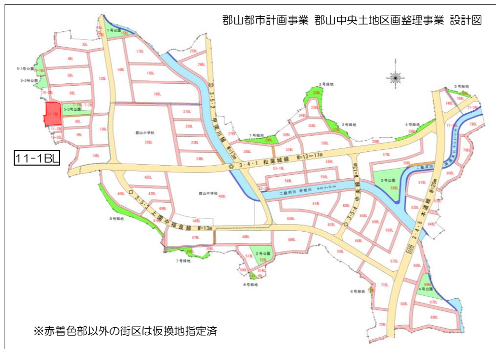
※赤着色部以外の街区は仮換地指定済