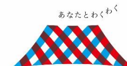
マルニオン ペビニオン