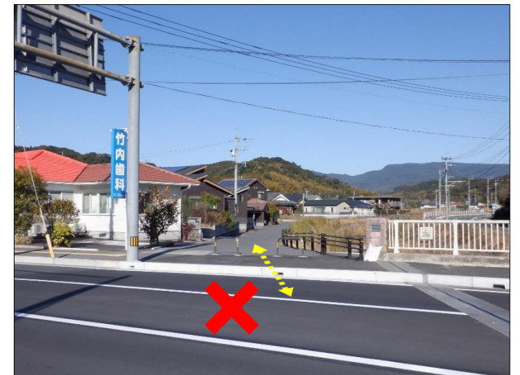
左写真の赤枠部は車両の出入りができなくなりましたので、郡山小学校側から出入りをお願いします。