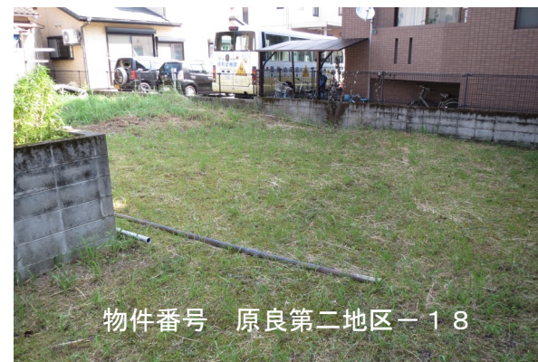
物件番号 原良第二地区-18

このほか、物件の用途の制限など、 詳細は随時売却実施要領(随時売却説明書)をご覧ください。