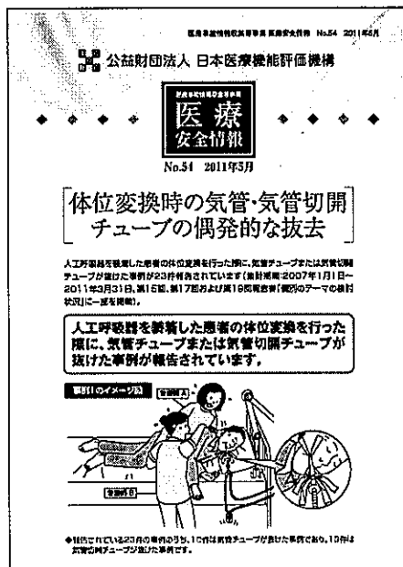
図表Ⅲ-3-17 医療安全情報No.5 4 「体位変換時の気管・気管切開チューブの偶発的な抜去」