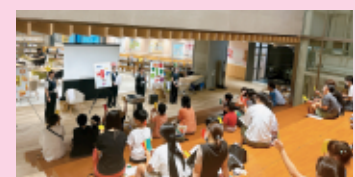
食べ物の赤・黄・緑