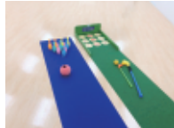
ボウリング& レクゴルフ