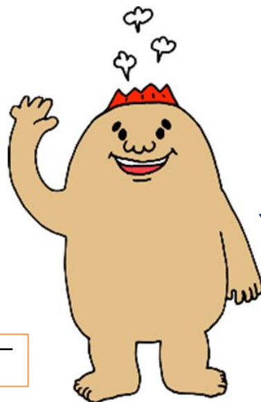
マグマシティPRキャラクター マグニオン（リキニオン）

事故発生の防止も、 ・ 委員会の実施 （定期的） ・ 指針の整備 ・ 定期的な研修 ・ 担当者の設置 が必要です。