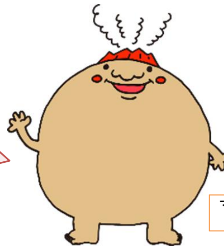
マグマシティPRキャラクター マグニオン（マルニオン）

職員の心身の健康に留意し、 職員の疾病の早期発見及び健 康状態の把握のために、定期 的に健康診断を行いましょ