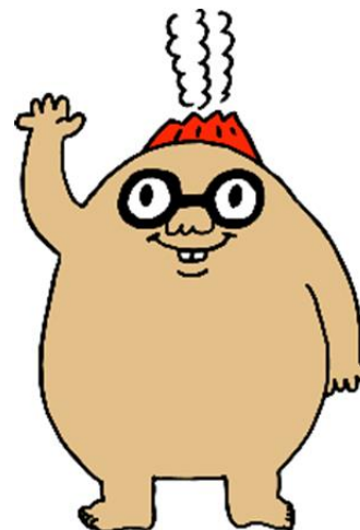
マグマシティPRキャラクター マグニョン（メガニョン）

入居者及びその身元引受人等の氏名及び連絡先を記載した名簿並びに入居者に供与したサービスの内容に関する帳簿等の個人情報の取り扱いについては、個人情報の保護に関する法律等を遵守することとされています。個人情報の利用に当たっては、入居者及び家族から同意を得ましょう。