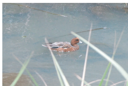
●ヒドリガモ：鹿児島県では冬に見られる。数百羽以上の大きな群れをつくる。