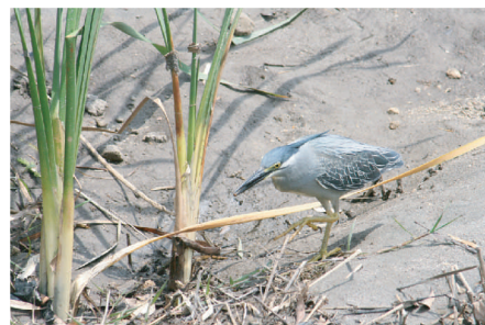
●ササゴイ：サギのなかま。魚道で待ちかまえて魚をとることもある。