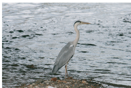
●アオサギ：大きいためツルとまちがわれるが、アオサギは首を曲げて飛ぶ。