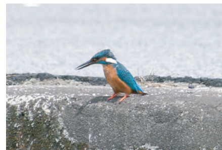
●カワセミ：市街地の川でも見られることがある。水中にダイビングし、魚をとらえる。