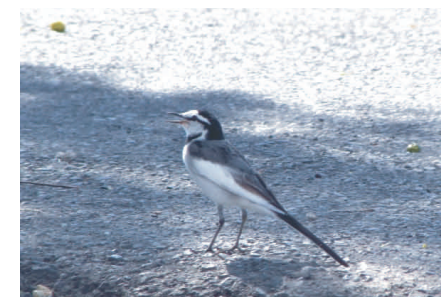
●ハクセキレイ：冬に見られ、道路の街路樹で休むことが多い。