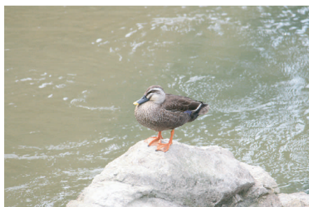
●カルガモ：川や水田で見られ、中洲や竹林など人目につかない所で子どもを育てる。