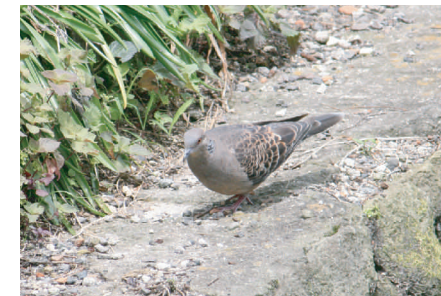
●キシバト：黒と茶色のうろこ模様がとくちょう。樹上に皿型の巣をつくる。