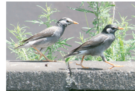
●ムクドリ：くちばしと足が黄色い。数万羽の群れをつくることもある。