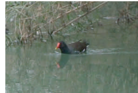
●バン：くちばし付近の赤と黄色が目立つ。植物が多い川や池に生息する。