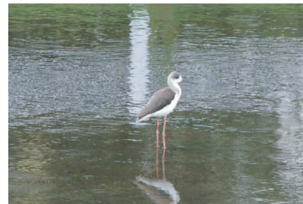
●セイタカシギ：環境省にて絶滅危惧Ⅱ類に指定。長いピンク色の足がとくちょう。