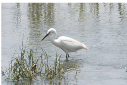
●コサギ：川や田んぼでよく見られる。くちばしが黒く、足先の黄色がとくちょう。