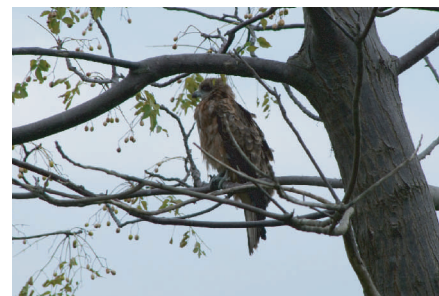
●トビ：主に動物の死体を食べる。カラスに追いかけていることが多い。