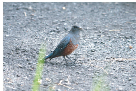
●イソヒヨドリ：本来海岸に多いが、市街地でも見られ、気に入った場所でもよく鳴く。