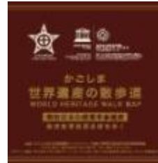
まち歩きマップ（日本語版）