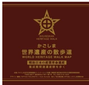
まち歩きマップ（日本語版）