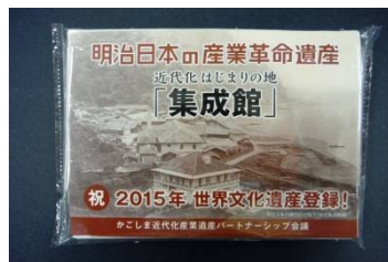
ポケットティッシュ