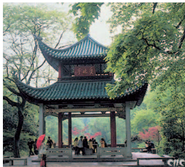
愛 晩 亭