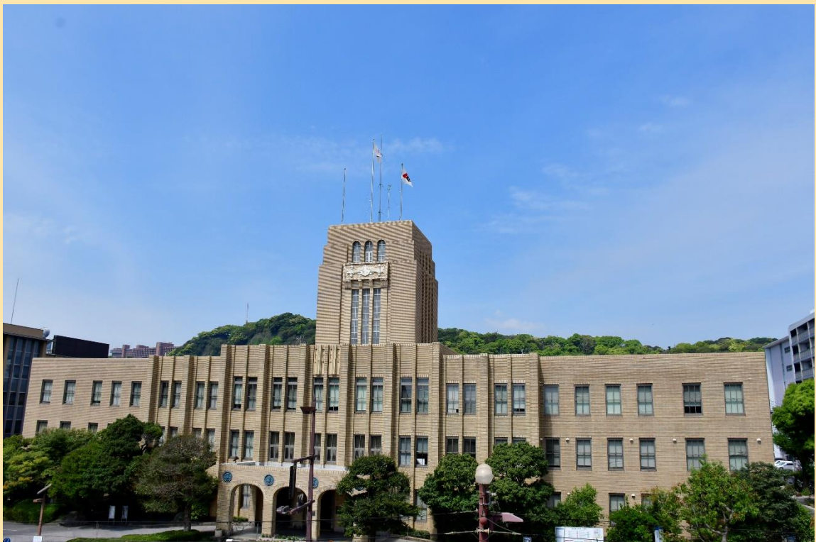
▶ 鹿児島市役所本館