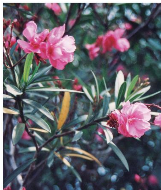
市花 きょうちくとう (昭和43年11月1日制定)