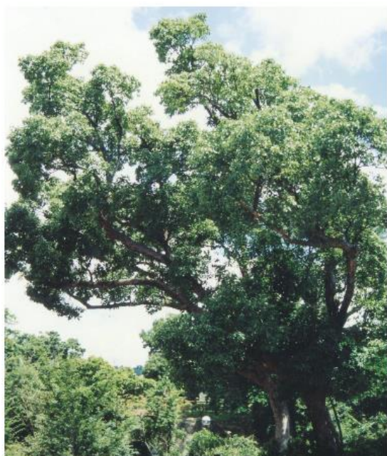
市木 くすのき (昭和43年11月1日制定)