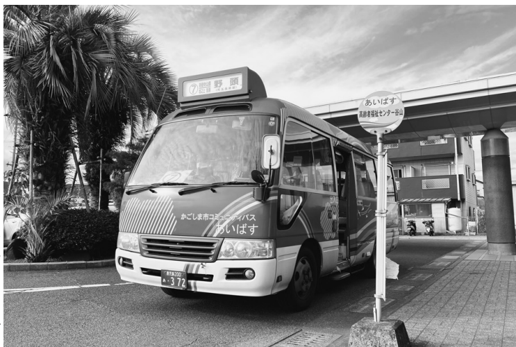
▶ バスロケーションシステムを搭載したあいばす