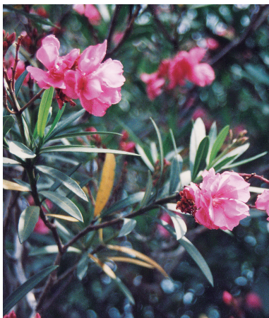
市 花 きょうちくとう (昭和43年11月1日制定)

( 構 成…市旗の構成は、白色の地に黒色の市紋章 (昭和42年鹿兒島市告示第5号)と赤色 の桜島の図形を配する。 規 格…縦2、横3の比率とする。 )