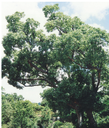
市 木 くすのき (昭和43年11月1日制定)