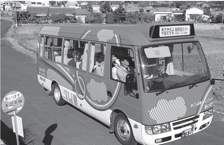
▶コミュニティバス「あいばす」