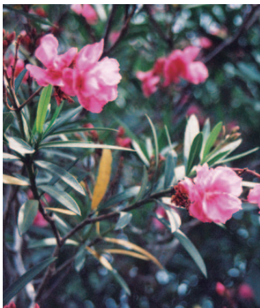
市 花 きょうちくとう (昭和43年11月1日制定)

( 構 成…市旗の構成は、白色の地に黒色の市紋章 (昭和42年鹿児島市告示第5号)と赤色 の桜島の図形を配する。 規 格…縦2、横3の比率とする。 )