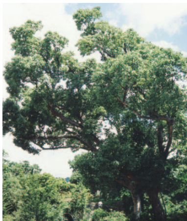
市 木 くすのき (昭和43年11月1日制定)