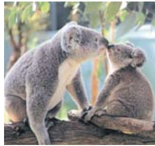
平川動物公園のコアラ

今後、交換についての手続きを進め、繁殖に取り組んでいきたいと考えている。 ※一月にオスは死亡しました。