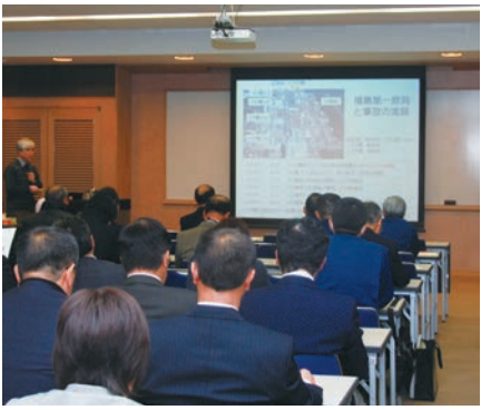
職員向けの「危機管理セミナー」(原子力防災について)

原子力防災アドバイザー委員については、放射線安全管理および被ばく医療に関する専門家として、鹿児島大学の准教授2人を平成24年11月に委嘱している。今後、本市地域防災計画の「原子力災害対策編」の策定に当たって、専門的な見地から意見をいただくほか、職員向けの研修講師などをお願いする予定である。