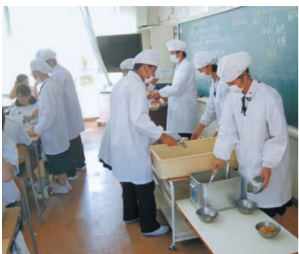
給食の準備(清水中学校)