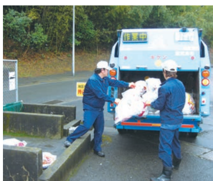
収集車によるゴミ収集

携や協働によるまちづくりを進める中で、さまざまな課題の解決に向けて、関係部局において調整を図りながら、引き続き、調査・研究したいと考えている。