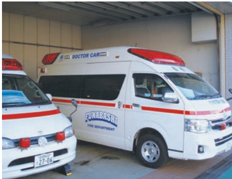
千葉県船橋市のドクターカー

導入に当たっては、専門の医師の確保や運用方式など検討すべき課題があり、現在、これらの課題について、消防局と市立病院が具体的な協議を行っている。また、導入する場合は、救急業務の一環として消防局が主体になるものと考えているが、基本的には、消防局が救急救命士を含む救急隊員の確保および高規格救急車等の整備を、市立病院がドクターカーに搭乗する医師や看護師の確保などを、それぞれ行うことになると考えている。