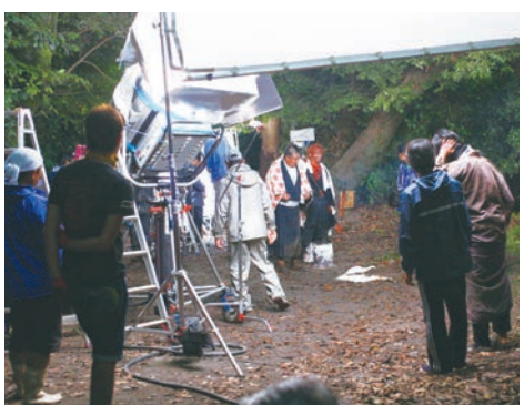
映画「半次郎」のロケ風景

また、交流人口の増加を促す観光の振興は、地域経済の活性化に大きく寄与することから、今後、九州新幹線の全線開業によりもたらされた効果を維持していくための取り組みを充実させていかなければならないと考えている。その中において、本市を舞台とした映画等の上映は、本市の持つ多彩な魅力を全国に情報発信でき、観光客誘致につながることから、今後、積極的に支援していきたい。