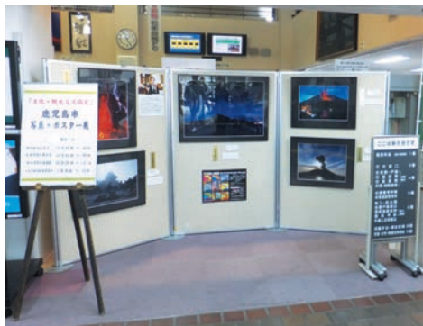
松本市での「鹿児島市写真・ポスター展」

今後の課題としては、行政の取り組みを市民レベルへ拡げていくことが必要であると考えている。