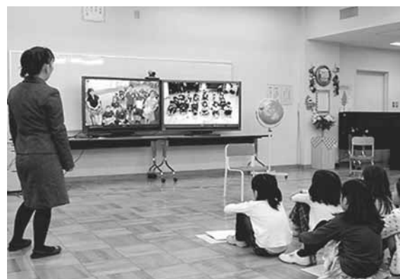
海外の学校とのテレビ会議を利用した授業風景