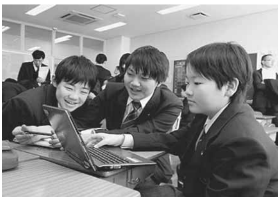
グループ学習における課題解決の様子