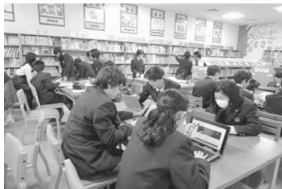
図書館とインターネットを用いた調べ学習