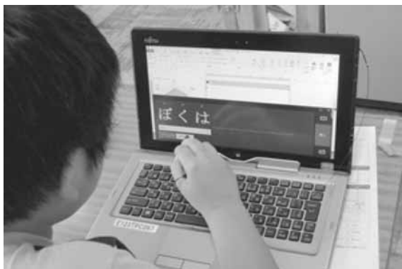
タッチペンを使ったドリル型学習の様子