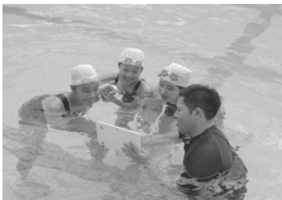
動画撮影機能を活用した泳法の確認の様子