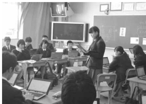
ディベート授業におけるタブレット投票