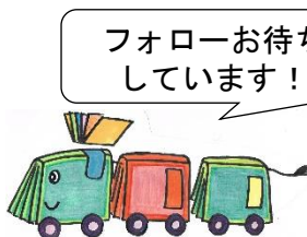
図書室キャラクター「ブックレッシュャー ポッパーくん」