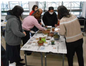
【一歩先行くパソコン活用術】 【多肉植物を楽しもう】