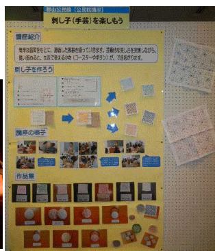
【郡山コーラスの皆さん】 【講座「刺し子を楽しもう」の作品】