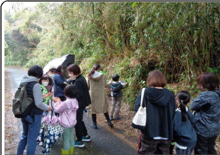
【親子ワクワク自然体験】

また、魅力ある後期講座も計画されています。詳しくは公民館だより9月号でお知らせいたします。多くの皆様の応募をお待ちしています。