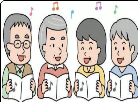
【シニア歌声サロン】

聴覚障害者の日常の不便さを理解し、手話や指文字などが身に付きました。また、受講生の仲間意識も高まりました。