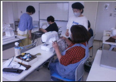
【ミシンでアップサイクル】

初心者にも分かりやすく、気さくに、また、書くポイントもていねいに教えていただいて、少し美文字に近づいたような？