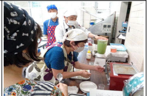
【みんなが笑顔“おうちごはん”】

ハギレの活用法や縫い合わせ方を教わり、バックや小物づくりに挑戦しました。世界に唯一の物ができました。