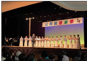
喜入グリーンコーラス

また、サンエールかごしま会場で開催された展示部門には、『給黎俳句会・菜の風俳句会』の皆さんによる「新年を詠む」と題した作品(俳句9点)が展示され、訪れた人々の注目を集めていました。