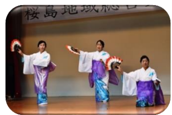
日本民踊あづま会