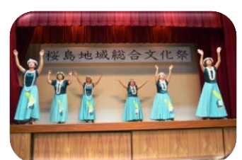
心うきうきフラダンス