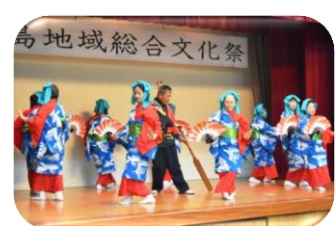
小池島廻り踊り保存会