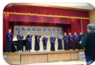
さくらじまハーモニー