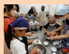
親子おやつ作り教室 1・2組