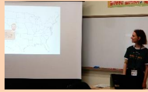
なるほど!ザ・ワールド～世界について学ぼう～