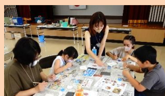
親子七宝焼き教室