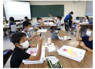
昨年度「わくわく科学工作」から

3つの夏休みならではの少年対象講座があります。紙版画、絵画、科学工作と、子どもたちだけで参加し、夏休みの課題につながるものもあります。1～2日の講座なので、気軽に御応募ください。