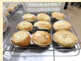
【ふっくらパンづくり】

パンの香ばしい香り漂う「ふっくらパンづくり」では、講座後に「仲間づくりもでき、協力して活動できました」や「さっそく家でもつくりたいです」と笑顔で話されていました。素晴らしい講師の先生方と熱心な受講生の皆様の姿は、