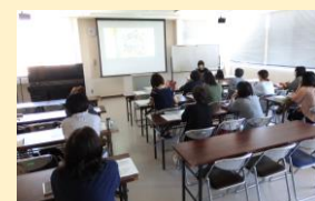
【暮らしすっきり！整理収納術の様子】

「暮らしすっきり！整理収納術」では講座が終わると「新しい考え方を知れました」や「帰ってすぐ取り掛かります」など、満足の表情で目を輝かせていらっしゃいました。