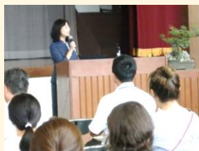
【家庭教育研修会の様子】

自分のこれまでを振り返る貴重な時間となり、さらに、この時間で学んだことを生活ですぐに実践したいと思える、たいへん有意義な時間となりました。