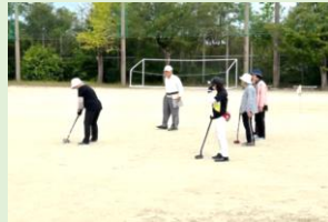
【グラウンド・ゴルフの様子】

グラウンド・ゴルフ会場では、グラウンドの状況を確認しながら「今日は砂が柔らかすぎるから、少し強めに打ったほうがいいよ」や、ホールの近くでは「やさしく打ったほうがいいよ。」など声をかけあい楽しくプレーしていました。