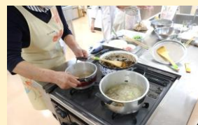
【楽々おうちごはんⅡの様子】

料理講座「楽々おうちごはんⅡ」は、毎回テーマがあり、ヘルシーな時短料理を楽しんで作られています。受講生から「簡単に華やかで健康的な一品ができて驚きでした」とコメントをいただきました。