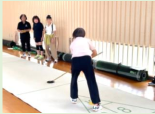
【シャッフルボードの様子】

参加者は、「あら、狙ったところと違った。」や「わたし、プロになれるかも。」など冗談を言いながら交流を図っておられました。またペタンクでは作戦を立て