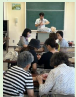
【脈拍の取り方の練習風景】

もしものことが起こらないことを祈っておりますが、対応の仕方を学ぶことはとても大事なことで強く感じた講習会でした。