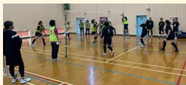
【昨年度の地域ソフトバレーボール大会の様子】

公民館では、スポーツの秋に地域の皆様が楽しめるように、様々な支援を行い地域の活性化に努めてまいります。地域の皆様が健康で充実した生活を送れるように、公民館として積極的に取り組んでまいります。