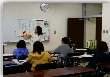
親子で楽しむ！絵本とわらべうた