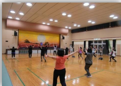
体幹エクササイズ