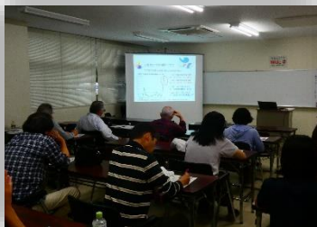
人生100年時代のマネー学