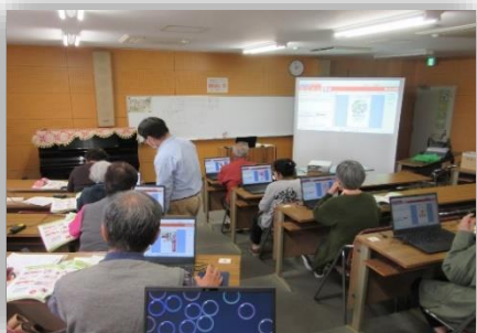
シニアやさしいパソコン～年賀状づくり編