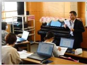
実践！ワード・エクセル

☆令和6年が、 谷山市民会館を 利用される皆様 にとって、幸多き 一年になりますよ うに！！