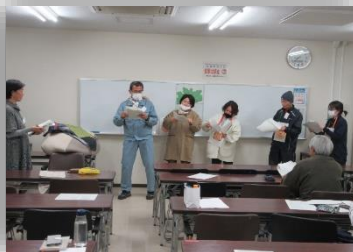
初心者のための英会話