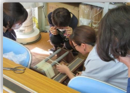
谷山再発見！谷山と大島紬

してほしい。」(楽しく体幹エクササイズ)、◆「先生が幅広い年代に向けて、わかりやすく説明してくださったので、資産運用やお金の使い方等、これからに生かせそうです。」(人生100年時代のマネー学)、◆「手作り絵本はやってみると楽しく取り組めて、皆さんのアイデアに感動した良い機会だった。」(親子で楽しむ絵本とわらべうた)、◆「とても楽しかった。久しぶりの英会話だったので、今後も英語の勉強を続けていきたいです。」(初心者のための英会話)、◆「先生が優しく接してくださり、声もはっきりと聞き取りやすく、ユーモアもあり、楽しい時間でした。」(シニアやさしいパソコン～年賀状づくり編～)などの感想が寄せられました。どの講座でも、講師の先生と受講生の皆様で、和やかな学習しやすい雰囲気を作り出し、充実した学びの時間になっていました。