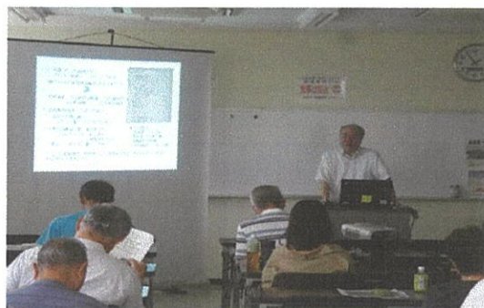
谷山再発見！ 谷山の歴史