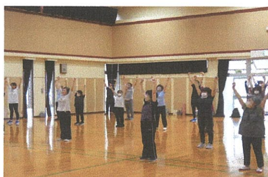
元気応援「健康体操」

10月からスタートする後期講座は、18講座を計画しており、9月1日（金）～20日（水）の期間に募集を行います。多数のご応募をお待ちしています。