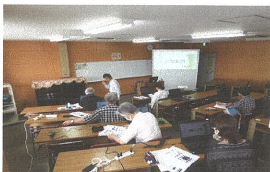
初心者のためのパワーポイント