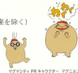
マグマシティPRキャラクター マグネオン