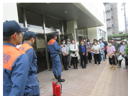
【鹿児島西消防署指導の様子】

まず、調理室で火災が発生したことを想定して行われた避難訓練では、的確な緊急放送及び迅速な消防署への通報の後、避難場所への機敏な避難及び適切な誘導等を訓練しました。避難後は消火訓練に加えて、火災受信機や非常用放送設備の使用等についても消防署から指導を受け、参加者全員で防火及び防災に対する意識を高めることができました。