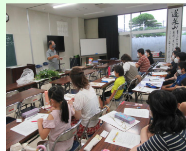
【親子で楽しむ植物採集】

7月1日(土)には「親子で楽しむ植物採集」の開講式が行われ、18人の親子が参加しました。館長や講師の先生の挨拶の後、植物採集の仕方や標本の作り方等を教わりました。夏休み期間中は、そのほか「ワクワク、ドキドキ科学実験」「親子うきうきクッキングⅠ、Ⅱ、Ⅲ(3講座)」「楽しい親子絵画教室」「楽しい親子工作教室」「親子で取り組む社会科自由研究」「楽しく踊ろう！ヒップホップ」の9講座に加え、今年は新たに「親子で学ぶ防災教室」を加えた10講座を実施しますので、是非親子で参加され、共に学び、共に感動する有意義な夏休みにしてもらいたいと思います。