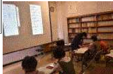
【アンディ先生と正子先生の英会話教室】