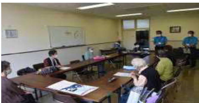
【楽しいパッチワーク開講式】

表・キルト綿・裏布を合わせて1枚布にするところからで、鯉などの縁のきわをステッチでひたすら縫う作業です。楽しみです。