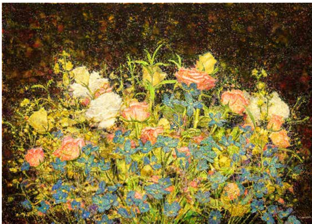
桶田洋明 《光華》 2021 A3 水彩