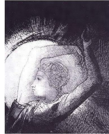
オディロン・ルドン《聖ヨハネ黙示録》「...日を着たる女ありて」1899年

本作品は、ルドンが木炭や版画による黒の世界から一転し(左図版)、油彩やパステルで花や人物などを色鮮やかに描き始めた時期に制作したもので、目を閉じたオフィーリアの描写や、小川や水辺の豊かな色彩が、見るものを幻想的な物語の世界へいざないます。