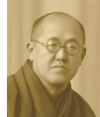
川瀬巴水 大田区立郷土博物館蔵

主催：鹿児島市立美術館、南日本新聞社、MBC南日本放送 特別協力：渡邊木版美術館 資料提供：大田区立郷土博物館 企画協力：株式会社ステップ・イースト 助成：一般財団法人自治総合センター