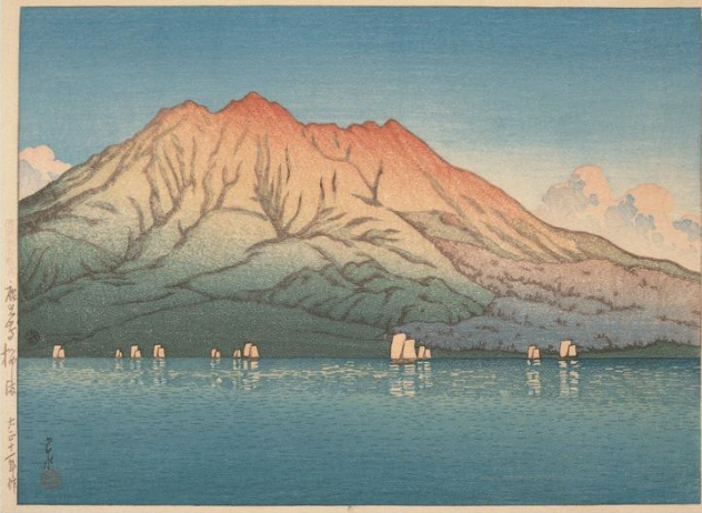
《鹿児島島桜しま》日本風景選集 1922(大正11)年

大正・昭和期に活躍した木版画家・川瀬巴水は、日本各地を旅するなかで目にした四季折々の風景を抒情的に表現し、「旅情詩人」と呼ばれました。浮世絵版画に新しい絵画表現を融合させた「新版画」を提唱した版元・渡邊庄三郎のもと、