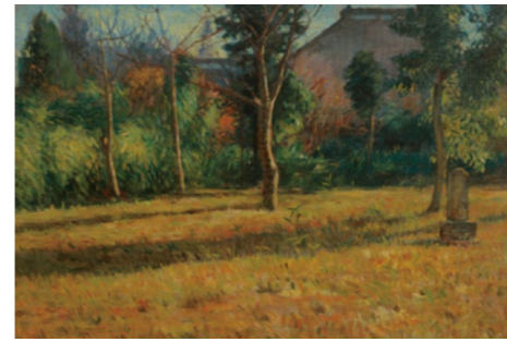
時任鵬熊 《谷中の墓地》1901年

この作品は、長いフランス留学から帰国して三年後、30歳の頃の作品です。自ら立ち上げた新傾向の洋画団体・白馬会の第一回展に出品されたこともあり、黒田の鼻息の荒さが如実に表