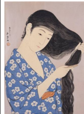
橋口五葉《髪梳ける女》1920年