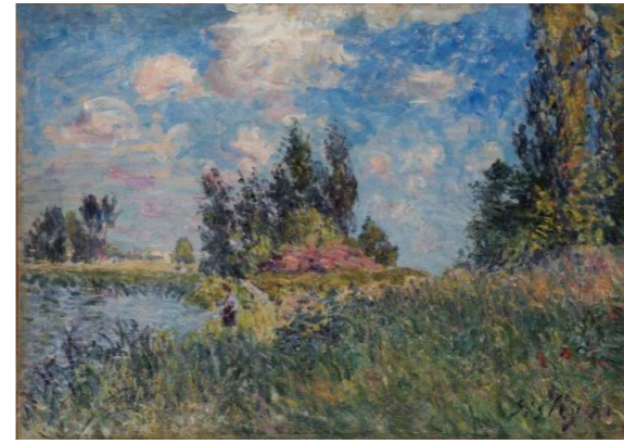
アルフレッド・シスレー《ザン・マスのロワ河畔の風景》1881年