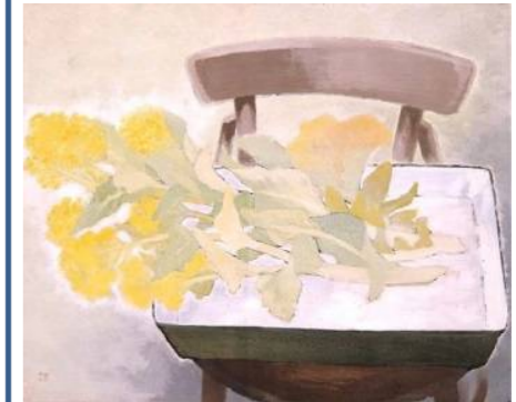
満田天民《菜の花》1954年

南大隅町出身の野添草郷(1897～1985)、薩摩川内市出身の松井黎光(1900～1974)、都城市出身の花房芳洲(1905～1980)、鹿児島市出身の満田天民(1905～1985)、知覧町出身の村永定観(1919～1992)ら5人の日本画家にスポットを当てます。洋画王国・鹿児島にゆかりがありながら、日本画の魅力にひかれ、伝統の技法を守りつつ、現代的な表現を生み出していった画家たちです。