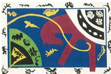
アンリ・マティス 《ジャズ（馬、女曲芸師、道化師）》1947年 鹿児島市立美術館蔵

『うさこちゃん びじゅつかんへいく』をガイドに、絵画や彫刻、工芸などさまざまな所蔵品を紹介します。