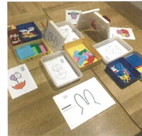
ワークショップコーナーのイメージ (写真は過去会場)

作品を見たあとは創作ワークショップコーナーを通じて、ブルーナのデザイン手法を楽しみながら体験できます。