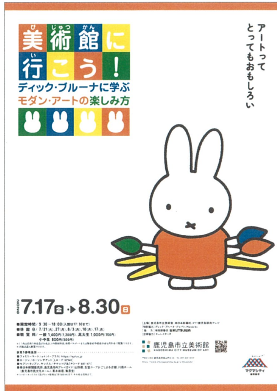
展覧会チラシイメージ

展覧会名 美術館に行こう！ ディック・ブルーナに学ぶモダン・アートの楽しみ方 会期 令和8年7月17日（金）～8月30日（日） 開館時間 午前9時30分～午後6時（入館は午後5時30分まで） 休館日 7/21（火）、7/27（月）、 8/3（月）、8/10（月）、8/17（月） 開催日数 40日間（最終月曜日開館） 会場 鹿児島市立美術館 一般展示室（1・2）、 企画展示室 主催 鹿児島市立美術館、 南日本新聞社、KYT 鹿児島読売テレビ 特別協力 ディック・ブルーナ・ジャパン、Mercis bv 協力 福音館書店、クツワ 企画協力 キュレーターズ 観覧料 一般 1,400円（1,200円） 高大生 1,000円（700円） 小中生 800円（500円）