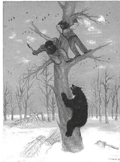
図版キャプション (左上から時計回りに)

山口長男《先》1963、油彩・合版 オディロン・ルドン《聖ヨハネ黙示録「またほかの天使も、天の場所から出て、同じく鋭い鎌を持っていた」》1899、リトグラフ・紙 海老原喜之助《樵夫と熊》1929、油彩・キャンバス 東郷青児《ギターを持つ女》1929、油彩・キャンバス ©Sompo Museum of Art, 23018