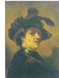
レンブラント 「羽根帽子をかぶった自画像」(黒田清輝模写) (東京芸術大学美術館蔵)