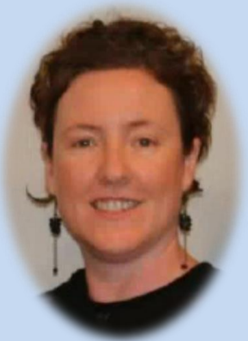
ミーガン・ブラザートン 審査員 (オーストラリア)

2020年度のセーフコミュニティ国際認証再取得に向け、10月24、25日の2日間に渡り、海外の公式認証審査員による事前指導を受けました！ 今回の事前指導でのアドバイスを本市の取組に生かしていきます！