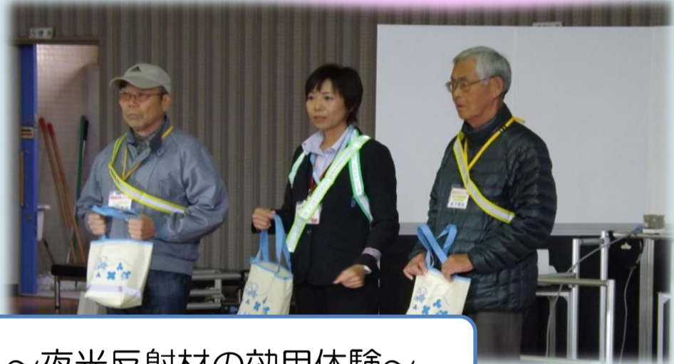
～夜光反射材の効用体験～