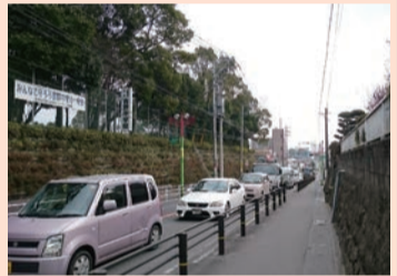
養護学校入口交差点～帯迫交差点

見通しのよい直線の幹線道路ですが、交通量が多く、昼夜を問わず多くの事故が発生しています。