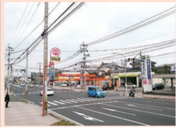
養護学校入口交差点付近