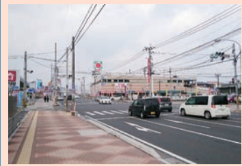
川上町花棚交差点付近

吉野小校区は交通量が多く、道幅が狭いうえ、歩道が少ない地域です。 このマップを活用して危険な場所を把握し、交通安全に努めましょう！