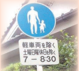
時間帯歩行者専用道路の標識

軽車両は軽自動車ではありません。 自転車、リヤカーなどが軽車両です。 例えば、下の標識では、「軽車両を除く」ですので、自転車等は通行できますが、軽自動車は通行できません。